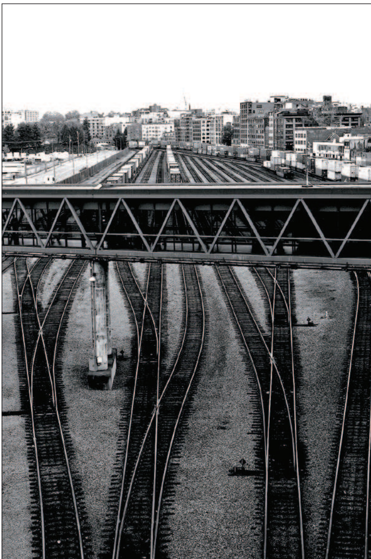
Přes koleje na SeaBus