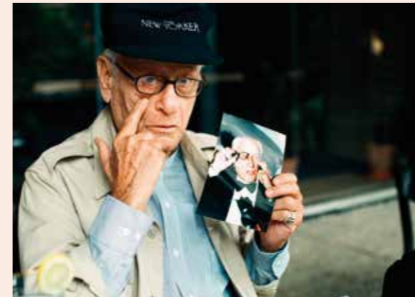
HEREC ELI WALLACH, 2000 „Eli Wallach byl velmi sympatický a mé slovenštině rozuměl tak dokonale, že si všichni ostatní mysleli, že má kořeny na Slovensku a svou rodnou řeč nezapomněl. Tato příhoda je jenom důkazem, že si lidé vzájemně porozumí, aniž mluví stejným jazykem.“