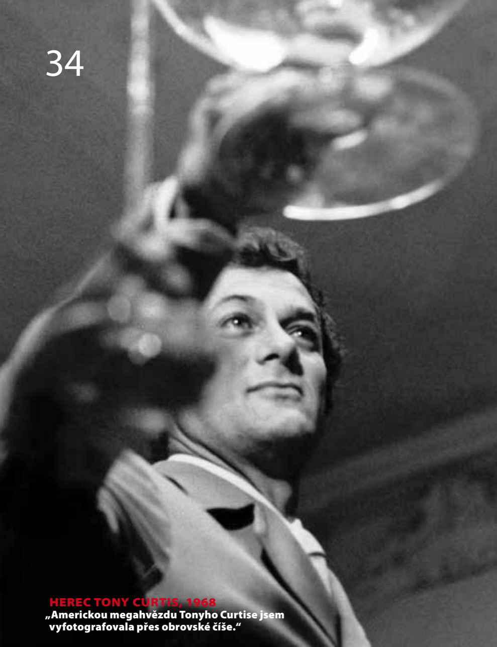
HEREC TONY CURTIS, 1968 „Americkou megahvězdu Tonyho Curtise jsem vyfotografovala přes obrovské číše.“