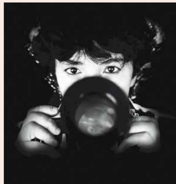
AUTOPORTRÉT „Můj autoportrét je z roku 1980. Vznikl, když jsem potřebovala svou fotografii, udělala jsem ji před zrcadlem. Už nikdy nebudu vypadat lépe než na této fotce.“