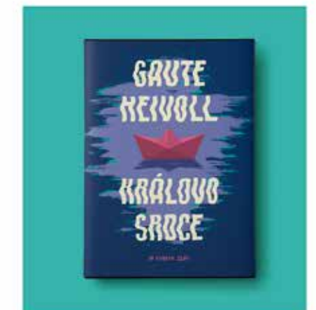
GAUTE HEIVOLL KRÁLOVO SRDCE

Intenzivní a hutné lidské drama založené na skutečných událostech vyprávěné jednoduchým, avšak velice poetickým jazykem, které zachycuje zoufalý pokus otce zachránit to poslední, co mu z rodiny zbylo.