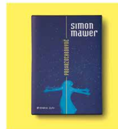
SIMON MAWER PROVAŽOCHODKYNĚ

Strhující román o neobyčejné ženě: ženě, která neváhá vraždit, hrdince i zrádkyni, který je současně propracovanou sondou do složitých motivů poválečného idealismu a mocenských vztahů.