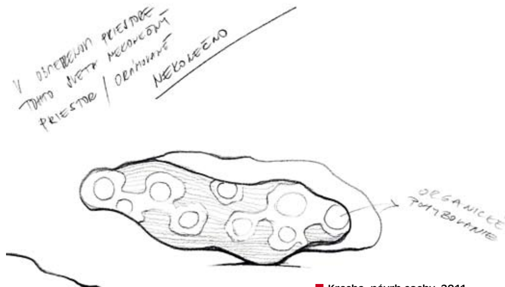
■ Kresba, návrh sochy, 2011