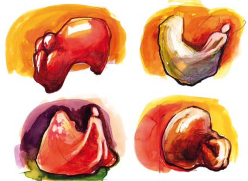
■ Akvarelová malba pro návrh sochy, 2007