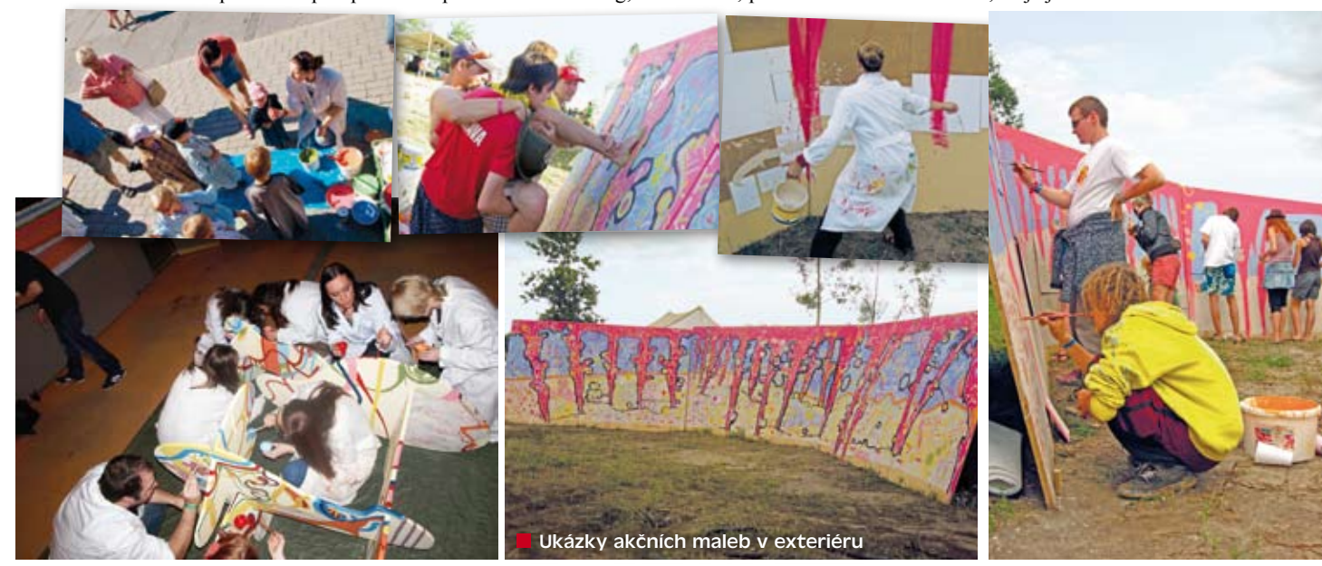
■ Ukázky akčních maleb v exteriéru

Zajímavé... Také mě to překvapilo. Ta barva mě zrovna teď napadla, evokuje ve mne duchovno a tajemství. Vnímám se jako duchovní člověk. Zřejmě proto jsem nikdy neměla zájem tvořit to, co je jenom viditelné... ■