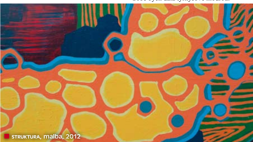
■ STRUKTURA, malba, 2012