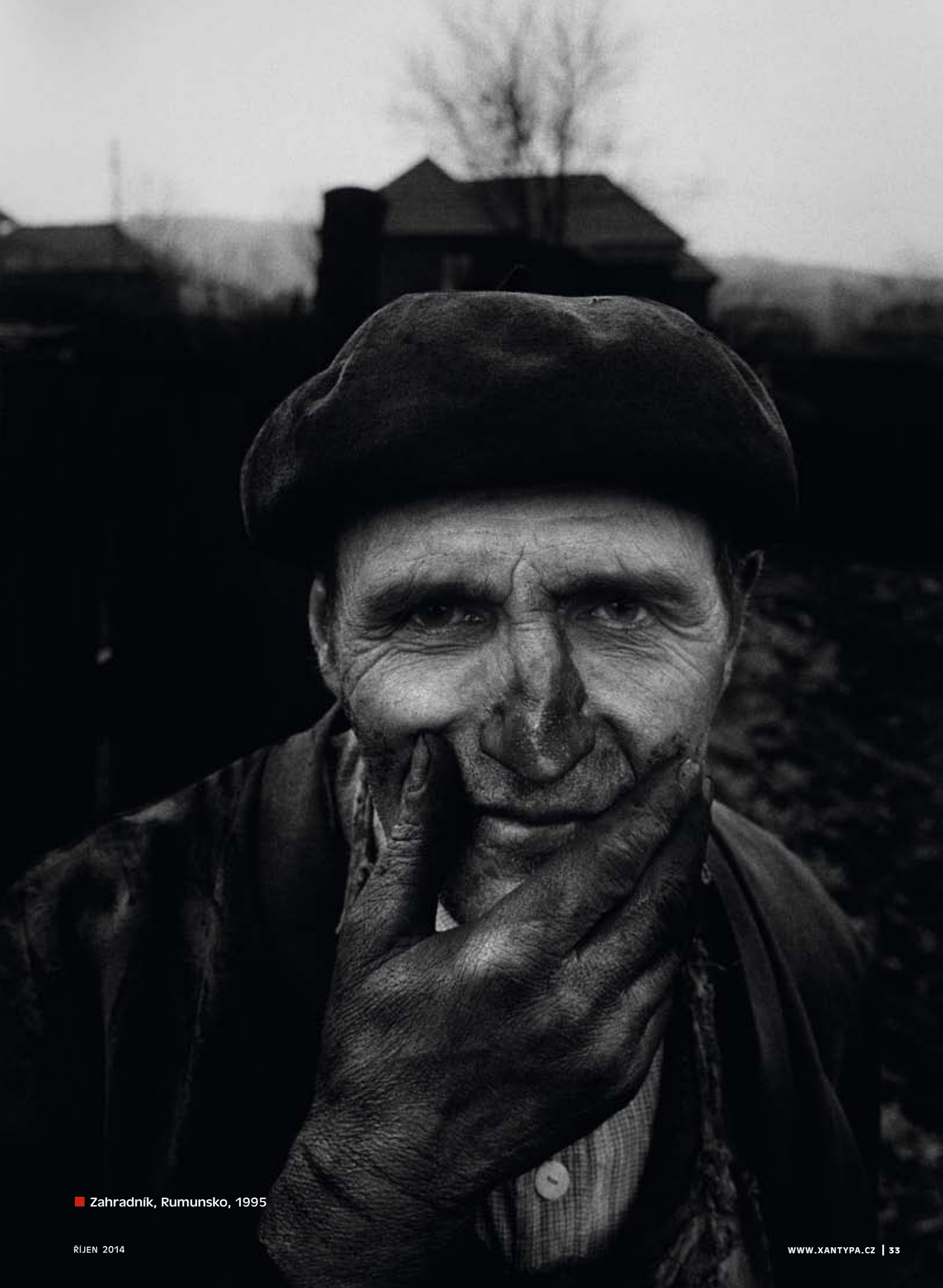
■ Zahradník, Rumunsko, 1995