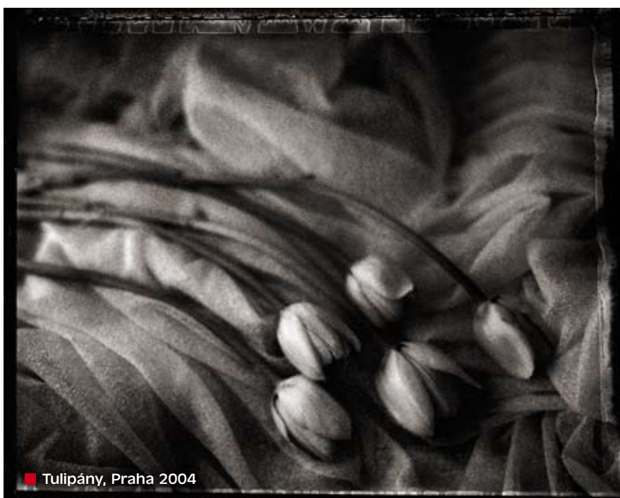
■ Tulipány, Praha 2004

v lokaci, do které se běžně nedostanete, oblečení, šperky, auta za miliony dolarů, co si téměř nikdo nemůže dovolit... Ale je dobré, že existuje i reportážní fotografie, protože alespoň víme, co se děje. Královna matka jednou řekla: „Prožila jsem dvě světové války a zhruba třicet krizí, a pořád se nic neděje. Nic se nestalo a všechno funguje dál.“