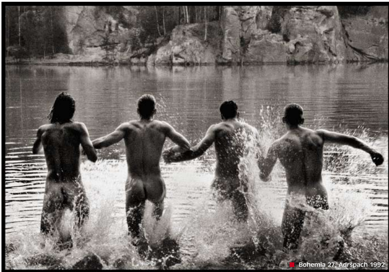
Bohemia 27. Adršpach 1992

cená pumpa. Nebo fotíte, jak letíte vzduchem. To jsou umělci... A vždy jsou nějaké trendy. Heparinový vrah, namačkaní lidé v autobusu, umírající na AIDS a podobně. Tohle ale nikdo nekoupí, protože to je deprese. Trendy většinou trvají čtrnáct dnů, a pak přijde další trend. Tak to doopravdy je. Každé dva roky v Americe vychází knížka o tom, jaké fotky se prodávají nejlépe. A představte si, že pořád se nejlépe prodávají stejné typy fotografií. Zřejmě to máme zakódované z minulých životů nebo to máme v DNA. Můžete dělat cokoli, když něco ale uděláte jinak, nikdo to nekoupí. Já ty trendy sleduji. Statistiky například uvádějí, že holky nakupují třikrát více než kluci. A víte, kde to všechno začalo?