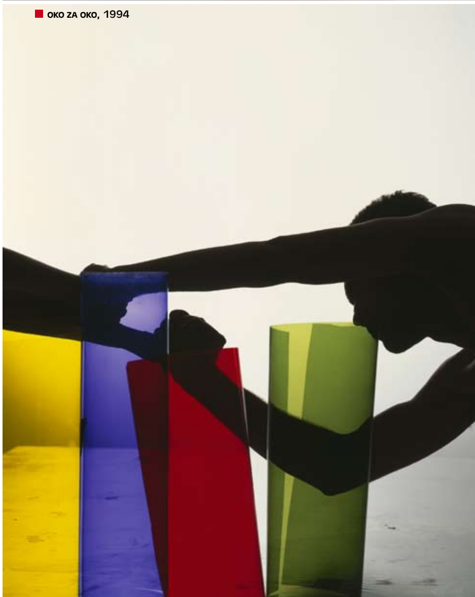
■ OKO ZA OKO, 1994