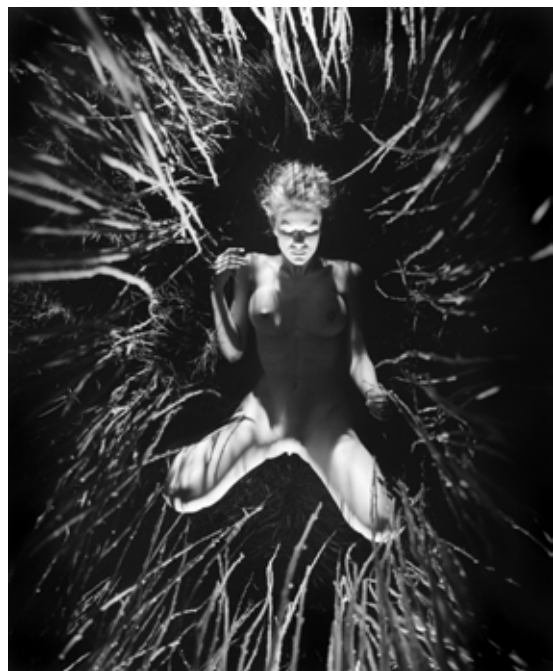
■ KOUZLO, 2001