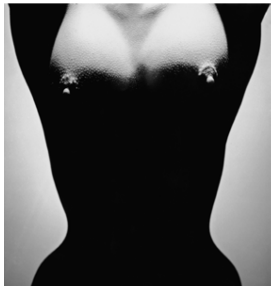
■ NAHOŘE, 1994