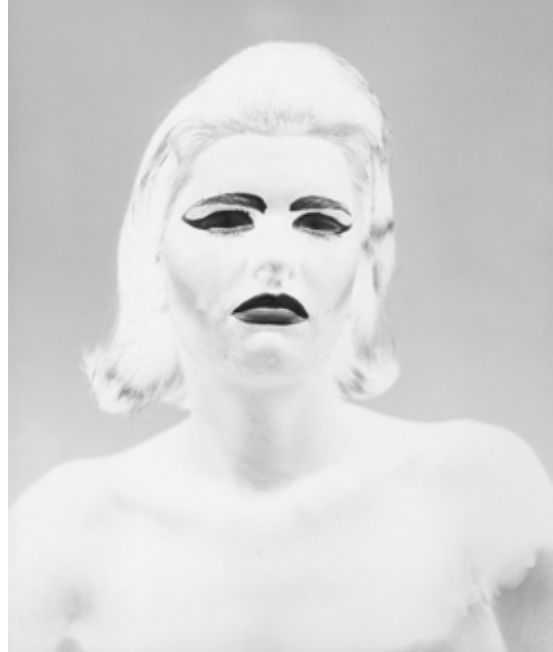
■ BÍLÝ STÍN, 1992

kdo talent, učitele nepotřebuje a svou cestu si najde sám. Když mi bylo sedmnáct, měl jsem velký sen a ten se mi splnil. Toužil jsem být na volné noze. Proto za svůj největší úspěch považuji, že jsem nebyl nikdy zaměstnán. I kvůli tomu jsem studoval FAMU. ■