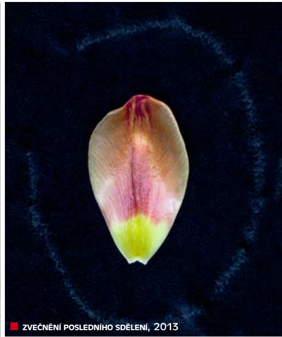
■ ZVEČNĚNÍ POSLEDNÍHO SDĚLENÍ, 2013