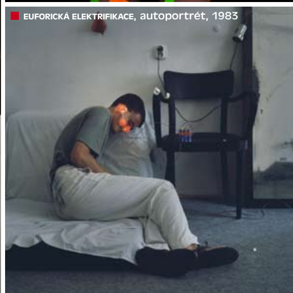
■ EUFORICKÁ ELEKTRIFIKACE, autoportrét, 1983