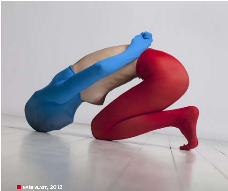
■ NAŠE VLAST, 2012