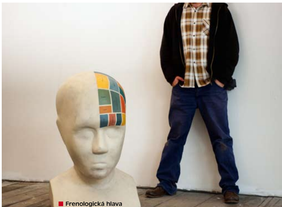
■ Frenologická hlava

Snažím se dávat maximum času do toho, co mě zajímá. Moc nemyslím dopředu, protože kdybych myslel, tak bych nedělal to, co dělám teď... ■